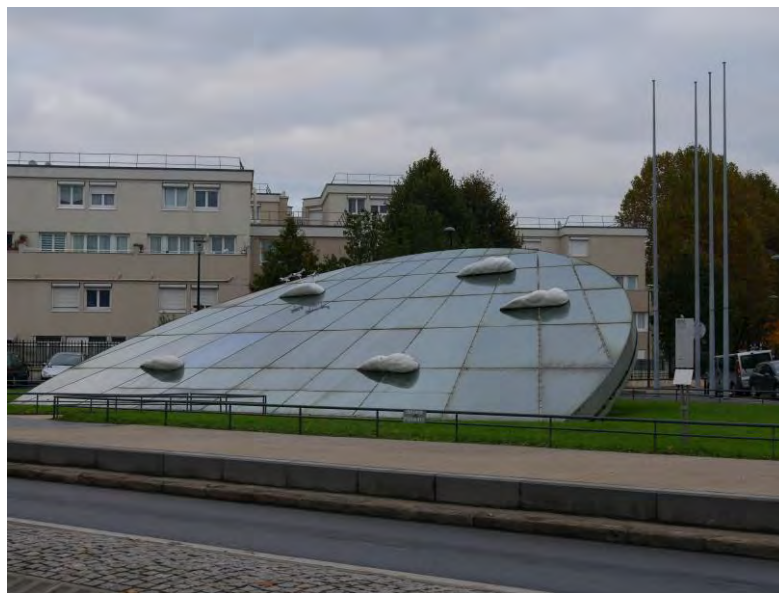
La place Charles de Gaulle

Appréciation : je sais gré au porteur de projet de partager mon intérêt pour l'art contemporain.